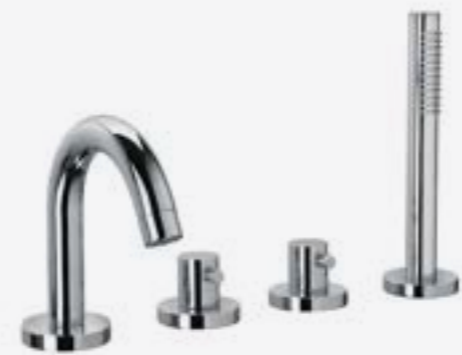
Vanová čtyř otvorová baterie