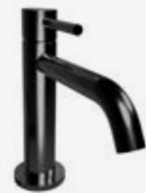
Stojánková baterie na WC umývátka