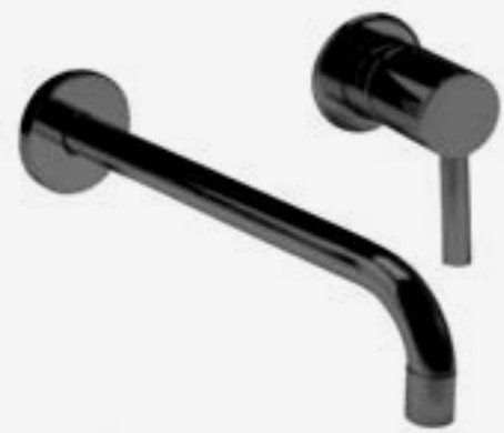
Umyvadlová nástěnná páková baterie